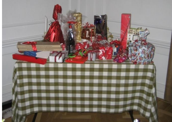
Vinstbordet till kvällens välgörenhetslotteri