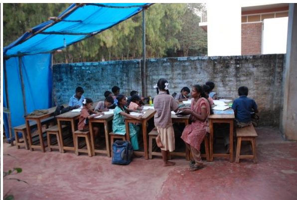
Läxläsning efter skolan för barn vars föräldrar är analfabeter, Yatra arts foundation, hemma hos familjen.