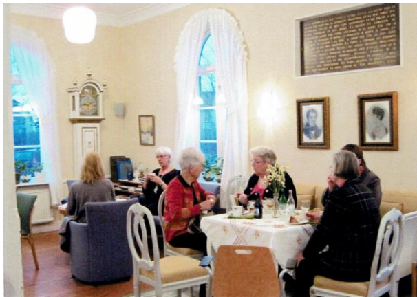
The och smörgås i salongen.