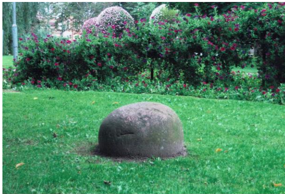
Minnessten över ett mord i stadsträdgården för ca 100 år sedan.