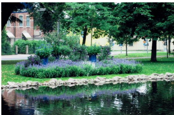
Blå rabatt symboliser översvämning år 2000.