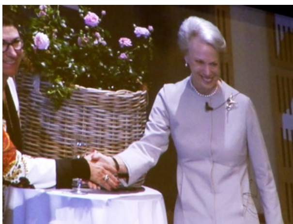
Prinsessan Benedikte med rosens odlare.