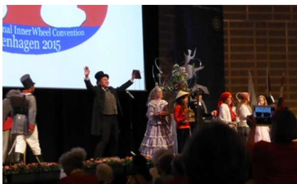
H C Andersen med Prinsessan på ärten m. fl.