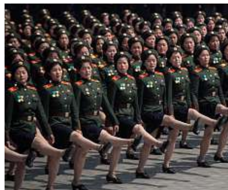
Militärparad i Nordkorea.