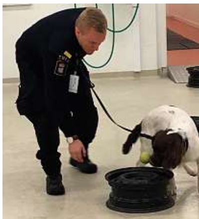
IW-hunden, Springer spanieln, Moss tränas att söka narkotika i en fälg.