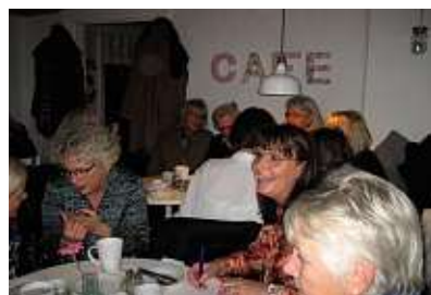
Glatt fikande i Lidköping.