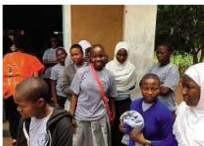
Foto: CAGADO= Campaign for Girls Against Drop Out from School.