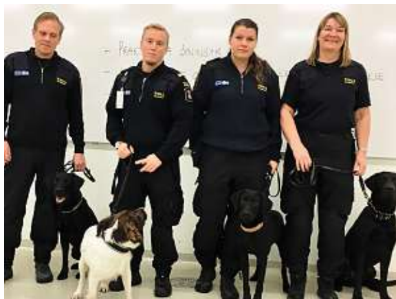
Fyra av våra nya hundar med sina förare på utbildning i Rosersberg i januari. Fr.v. Bajas Labrador, Moss Springer spaniel, Dias Labrador och Bailey Labrador.