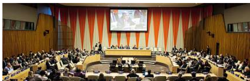
FNs Ekonomiska och Sociala råd i möte i New York 2017.