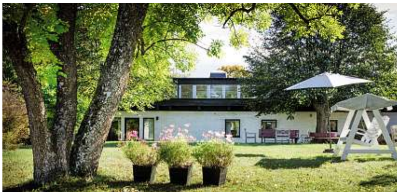
Silviahemmet på Ekerö utanför Stockholm.

Vaskulär demens och frontotemporal demens är andra vanliga demenssjukdomar. Även alkoholmissbruk, B12-brist och en rad andra sjukdomstillstånd kan i en del fall leda till demens. Vissa av dessa s.k. sekundära sjukdomar är behandlingsbara.