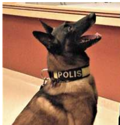
Kaliber sitter fint och väntar på sitt ben som han fick som tack för ett bra jobb.

Hans hund Kaliber är fyra år gammal. Polishundarna rekryteras från Försvarsmakten eller vissa kennlar. Poliserna kan även köpa egna valpar och träna dem själva. Polishundarna, som ägs av polismyndigheten, bor hos hundföraren och följer med denne till jobbet.