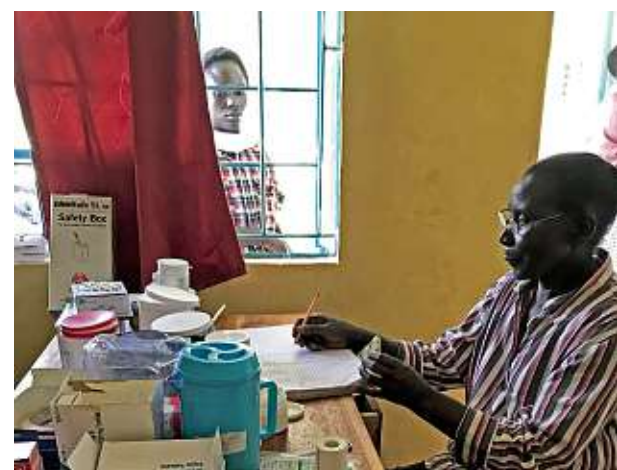
Ovan till vänster sitter apotekaren med sitt lilla medicinförråd och t.h. skrivs patienterna in i journalerna.