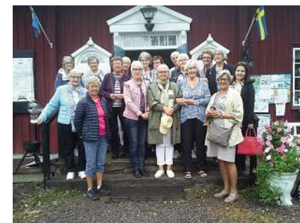
Alla glada damerna framför Värmskogs Café

Sen bar det av till Karlstad och Mariebergsskogen. Först blev det en guddad tur med tuff-tuff-tåg genom parken. Alla barn vinkade glatt åt oss. Dagen avslutades med god samvaro och middag i Karlstad. Det regnade hela dagen men alla var nöjda och belättna. Alla tjugo deltagarna ser fram emot nästa möte.