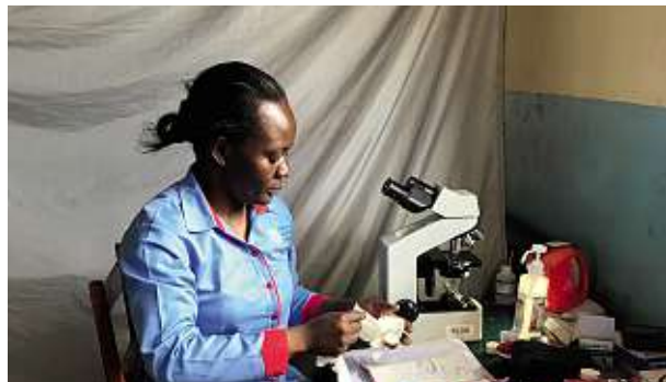
Detta är laboratoriet på en mottagning. Ofta är det en kyrka som avdelats med provisoriska skynken under en dag. Det finns varken el eller vatten i lokalen.