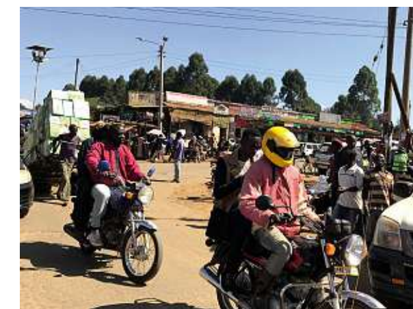
Ovan, en vanlig gatubild. Möte mellan en modern bil, mopeder och dragkärra. Mopeder är det vanligaste forskaffningsmedlet på landsbygden. Mopeden används både som taxi och för varutransporter.