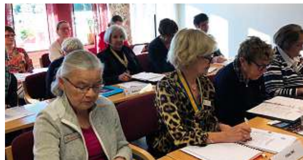
Koncentrationen var stor när D 233 hade sitt DÅM i Mora.