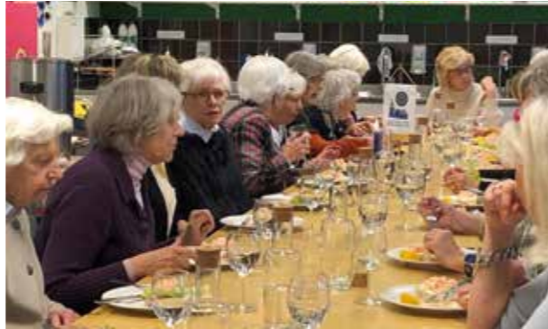
Text Kerstin Hellberg.

Eftersom det var många gäster med så passade det särskilt bra med en genomgång av Inner Wheels syfte och de olika hjälpprojekten.