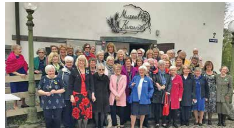
Stort jubileumsfirande när Filipstad IWC fyllde 70. Ett 80-tal gäster från Helsingborg i söder till Boden i norr var på plats och hyllade jubilarerna.