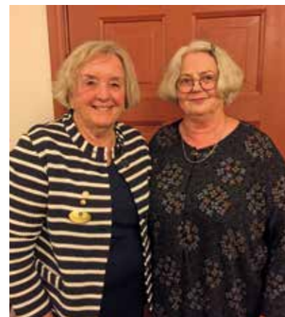
Text och foto Nina Svanberg

inför fortsatta hjälpprojekt. De genomförde ett 25-tal djupintervjuer på plats med barn och unga vuxna som fått en ny start i livet genom skolan.