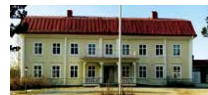
Stiftsgårdens huvudbyggnad i Skellefteå.

Om förslaget vinner gehör i Sverige är tanken att försöka få med alla andra länder. Det vore en styrka om vi kunde enas om ett gemensamt projekt tycker motionärerna - och rådet.