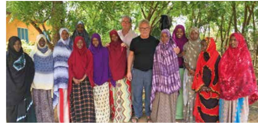
Flickorna som nyss gått ut skolan och är på väg att lämna så fort de fått någonstans att bo. Några till vidare utbildning och några ut i arbetslivet.

görs också för att avskaffa traditio-nen med könsstympning.