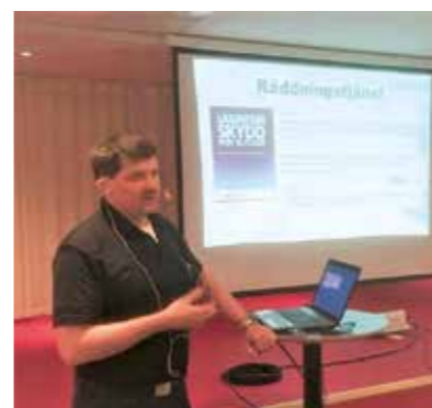
Text och foto Kerstin Jergil

Vid enheten för Räddningstjänst och samhällsskydd i Västerviks kommun finns alltid 28 personer av totalt 143 anställda i beredskap dygnet runt.