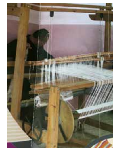
Text och foto Ingrid Nilzén

Samhällsutvecklingen och synen på förståndshandikapp har blivit betydligt bättre på senare år. Samtidigt är Palestina ett mycket fattigt land.