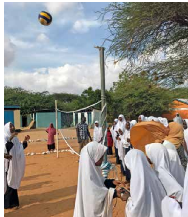
Vollyboll i 35-gradig värme gav oss tufft motstånd från flickorna.

Kvinnoväld, tvångsgifte och den ofattbara könsstympning-en pågår fortfa-rande i stor ut-sträckning trots att det är i lag