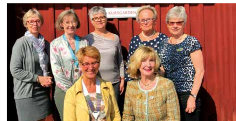
De som tog sig fram till Stiftsgården i Skellefteå fick några dagar med fint väder med givande och trevlig samvaro.

En motion hade inkommit från D 239 angående det gemensamma internationella projekt som ska beslutas på nästa Convention i Indien 2021. Förslaget som ska ut på snabbenkät bland klubbarna avser Dr Denis Mukweges verksamhet vid Panzsjukhuset i DR Kongo.