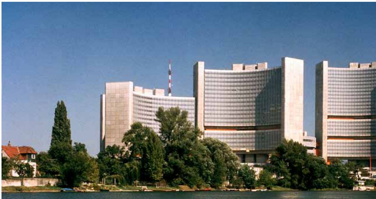
Den eleganta FN-byggnaden i Wien.