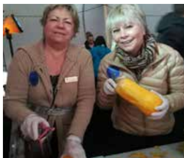
Gåvor till vården från IW-medlemmar ses på många bilder.