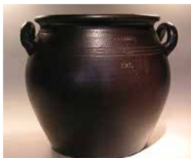
Höganäs kruka.

Höganäs IWC hade bjudit in överläkare, tillika Silvialäkare Moa Wibom från minnesmot-