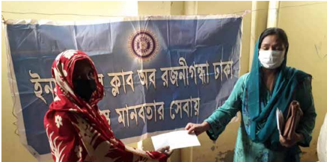
Bilder utan text på sidorna visar IW-medlemmar från Sydafrika, Bangladesh och Filippinerna, som arbetar med frivilligt hjälparbete.