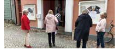
Text och foto Birgitta Henning

Eksjö IWC kontaktade stadens biograf. Där visas önskad film om man är fler än 8 personer. Vi blev 30 personer som såg filmen "Unga kvinnor" och hade rejäla avstånd mellan oss. Härligt att kunna ses och prata lite och få en gemensam upplevelse av filmen. Vi kommer att upprepa detta.