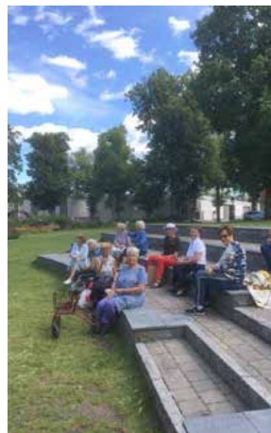
Medlemmarna i Västervik håller avstånd.