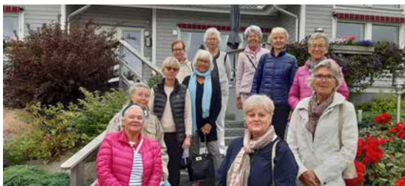
Text och foto Britt Gars Petersson

Tack alla medlemmar för att ni rensade i era förråd.