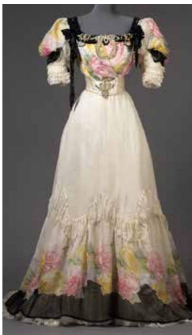
Till denna klänning, sydd 1906, bars guldskor och gula strumpor.

Stora revolutionen kom i början av 1900-talet i samband med kvinnans början till frigörelse. En modemedveten ung dam lät kortklippa sig, slänga korsetten och bar en löst hängande klänning som slutade strax under knät till äldre generationens stora fasa.