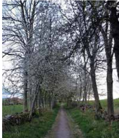
Promenadstigen Oxdrivet i Skulptorp, Skövde, i full körsbärsblom.