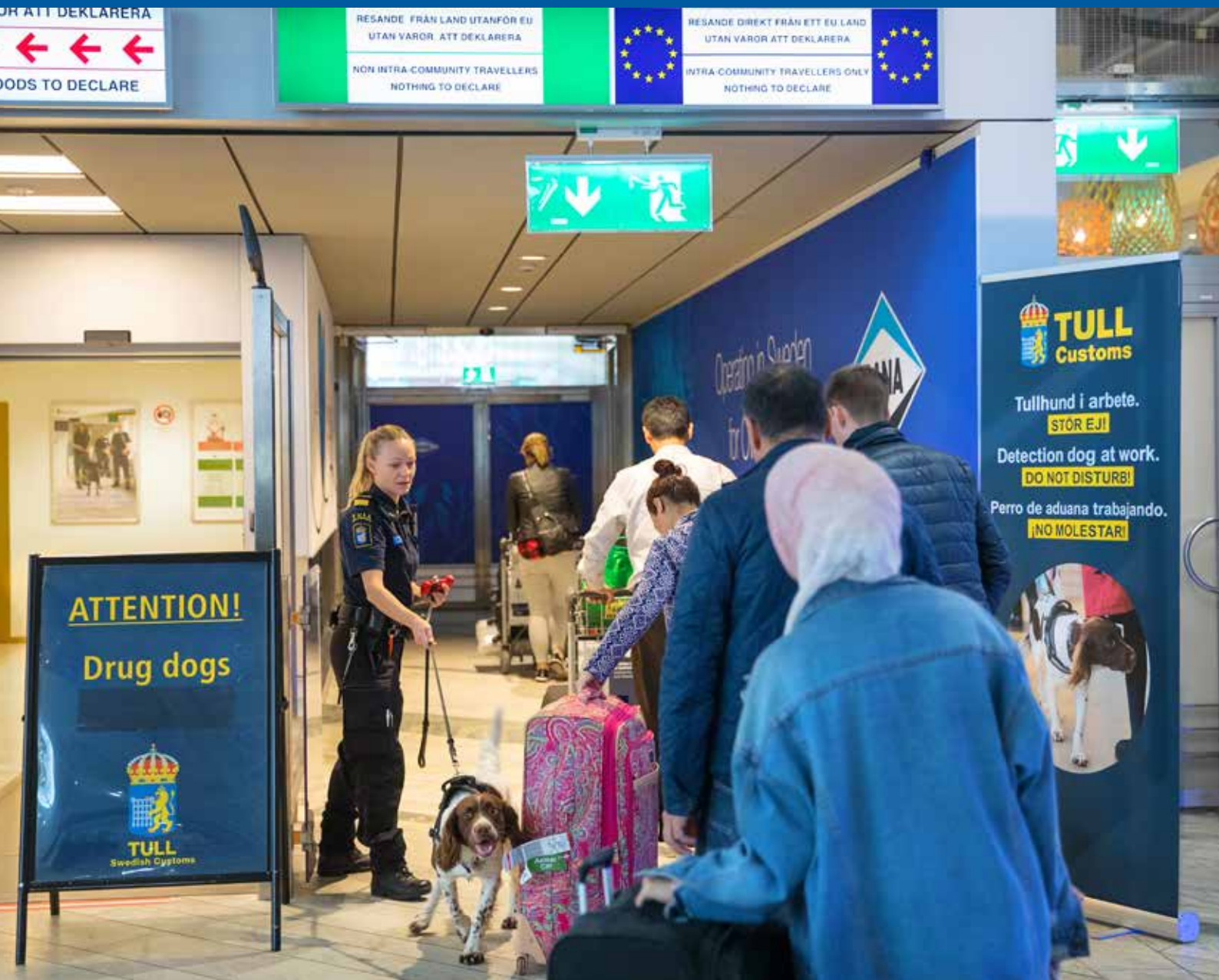
Tullverkets IW-hundar bevakar Sveriges gränser.

INNER WHEEL NYTT SVERIGE | NR 4 2020 | ÅRGÅNG 53