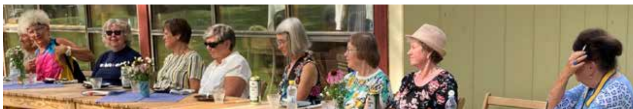
Text Monica Petterson