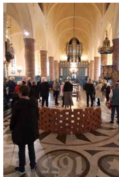
Kristine Kyrka i Falun efter renoveringen. Text Margareta Schelin

Vi gick runt i kyrkorummet och imponerades av resultatet av den ljusgula färgnyansen i takmålningen, som fått kyrkan att se större ut och kännas varmare.