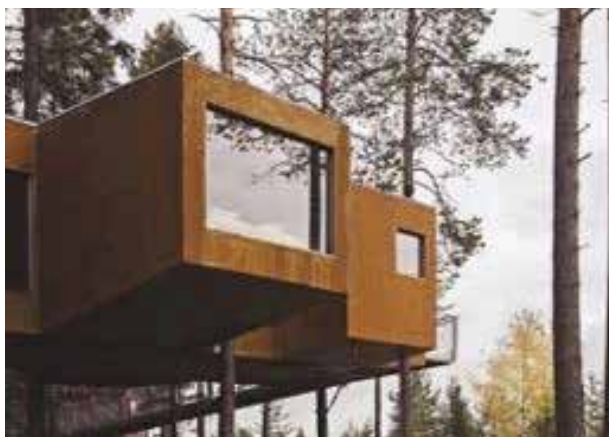
"The Dragonfly", Trollsländan, är ett av de sju hotellrummen.