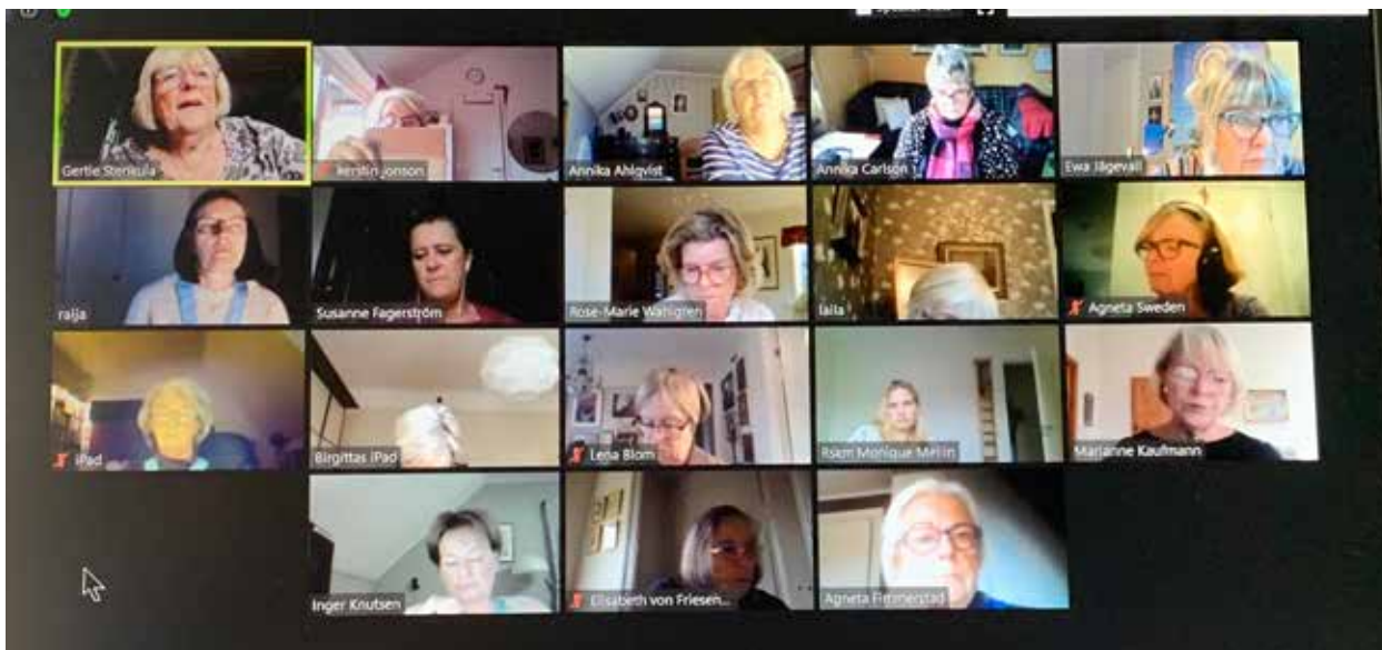
Rådsårsmöte på Zoom den 14 november med alla distriktspresidenter, Rådets VU och inbjudna funktionärer.