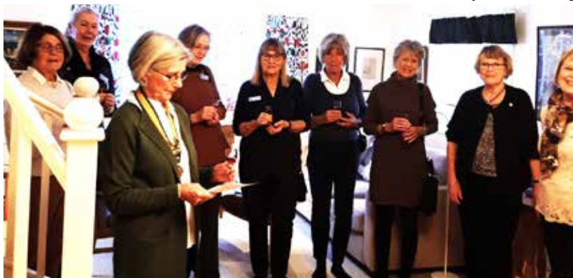
KP Lena berättade om Inner Wheels historia och varför vi firar just den 10 januari.