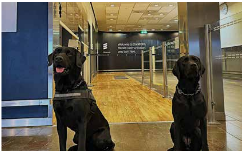
Två IW-hundar, Fanny och Jack, på utbildning i Rosersberg för sista provet inför certifiering.

-Jacks förare har dock vänligt men bestämt avböjt detta. Tullverkets arbete med Narkotikabekämpning är ytterst utsatt och man värnar om hund och förares säkerhet. Fullt förståeligt!