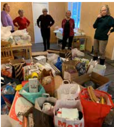
Före jul samlade klubben ihop tre billaster med förnödenheter som hygienartiklar, sängkläder, leksaker till barnen m.m. till Kvinnojouren i Sandviken. Ett mycket välkommet bidrag.

Rapatac är ett unikt aktivitetscentrum för barn och ungdomar som vill skapa goda för-