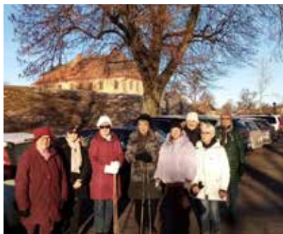
Varje tisdag samlas Nyköping Öster och går en promenad.

Nyköping Öster IWC startade med tisdagspromenader under hösten 2020 då vi insåg att vi inte skulle kunna hålla våra ordinarie månadsmöten.