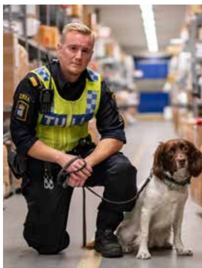
Årets vinnare, Moss, med förare.

-För närvarande tjänstgör 23 sökhundar försedda med den gyllene IW-brickan vid Sveriges gränser. Hundekipagen gör gärna besök hos Inner Wheels klubbar