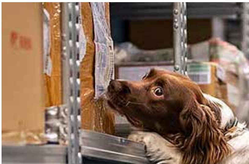
Moss på jakt efter narkotika eller vapen vid post- och fraktflödet i södra Sverige.