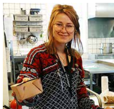
Det delas även ut matkassar en gång i veckan. Text Eivor Lundgren.

Anna berättar att man erbjuder skyddat boende för våldsutsatta kvinnor på uppdrag av Socialtjänsten. Många av dessa kvinnor har husdjur som de inte vill lämna, så man tar emot dem också. Man är även den enda i Norrland som tar emot missbrukare.