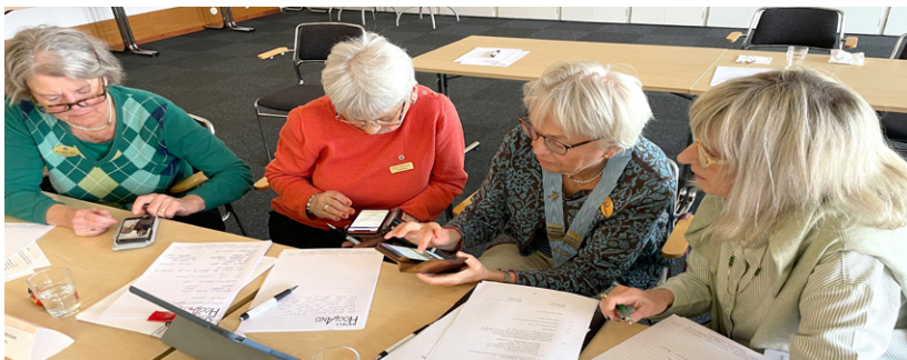
På RM i Nässjö arbetades det flitigt med att söka uppgifter på datorer och telefoner.