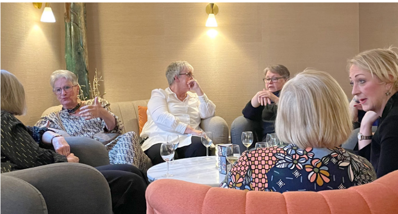
Viktigt med tid att träffas och trivas tillsammans.