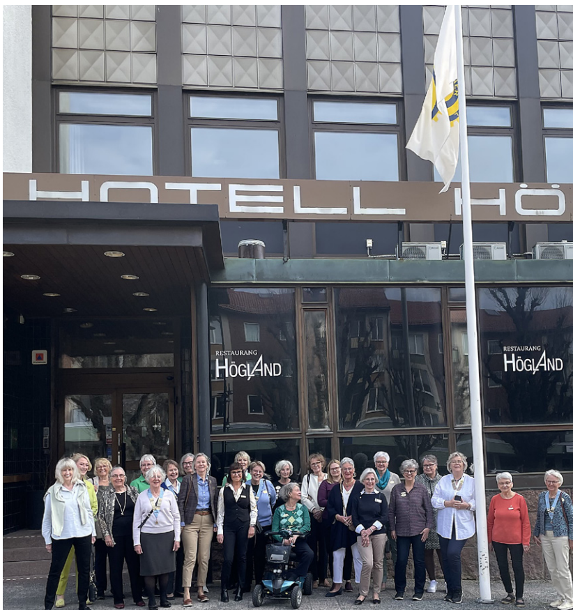
Här vajar Inner Wheel-flaggan stolt utanför Hotell Högländ i Nässjö.