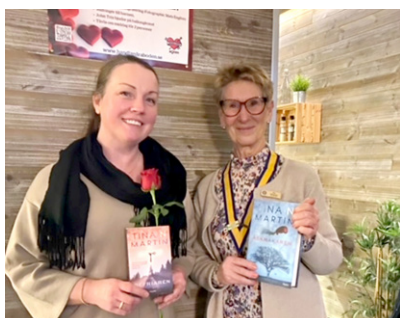
Text och foto Åsa Karlsson och Agneta Ogbonnaya

tackade Carina med IW-rosen. Vi avslutade kvällen med att sjunga "Syrans sång".