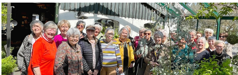
Värligt möte i växthuset på Österlenkryddor.