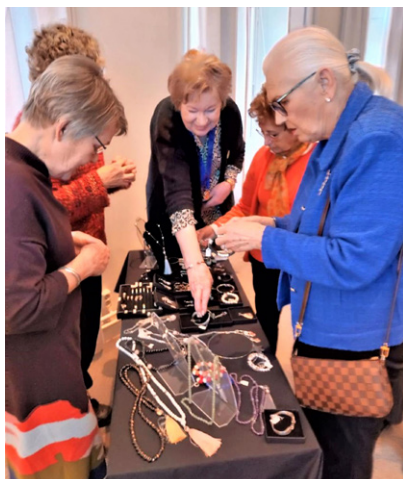
Sussis smycken beundrades.

2013 kom boken "Varje dag är en match" ut. Vid sidan av sitt