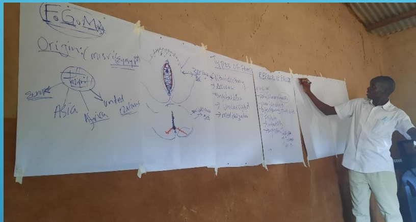
Information om könsstympling