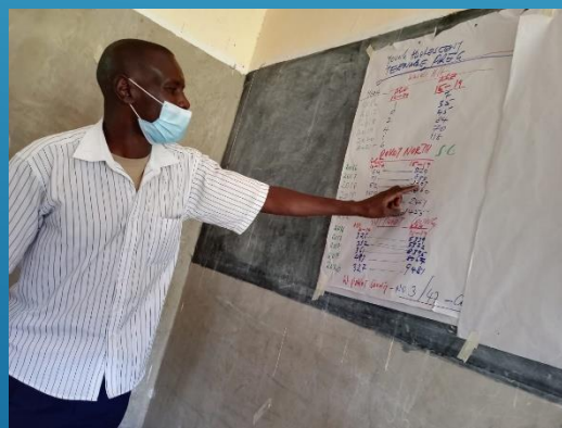
Siffror på tonårsgraviditeter