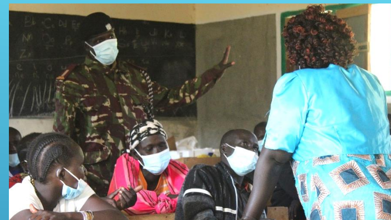
Diskussion med "chief" i området som också deltar.